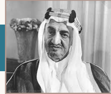
الملك فيصل بن عبدالعزيز آل سعود رحمه الله

«لقد كنا نعيش تحت الخيام ونستطيع أن نعود إليها، فإن نخسر المال خير من أن نخسر الشرف».