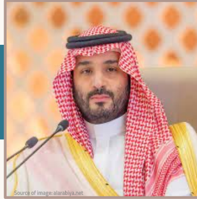
الأمير محمد بن سلمان آل سعود ولي عهد السعودية

«أريد أن نعيش حياة طبيعية, حياة تُترجم ديننا السّمح وعاداتنا وتقاليدنا الطيبة, ونتعايش مع العالم ونساهم في تنمية وطننا ووطن العالم».