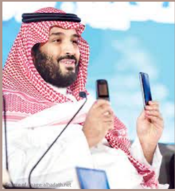
الأمير محمد بن سلمان آل سعود ولي عهد السعودية

«الفرق الذي سوف يكون في نيوم كزون وكالمدينة التي سوف تكون داخل نيوم مثل الفرق بين هذا الهاتف وهذا الهاتف».