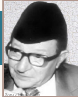
علي الوردي أستاذ مؤرخ

«الفكر البشري حين يتحرر ويخرج عن التقاليد، لا يستطيع أن يحتفظ بطابع اليقين على أيه صورة».