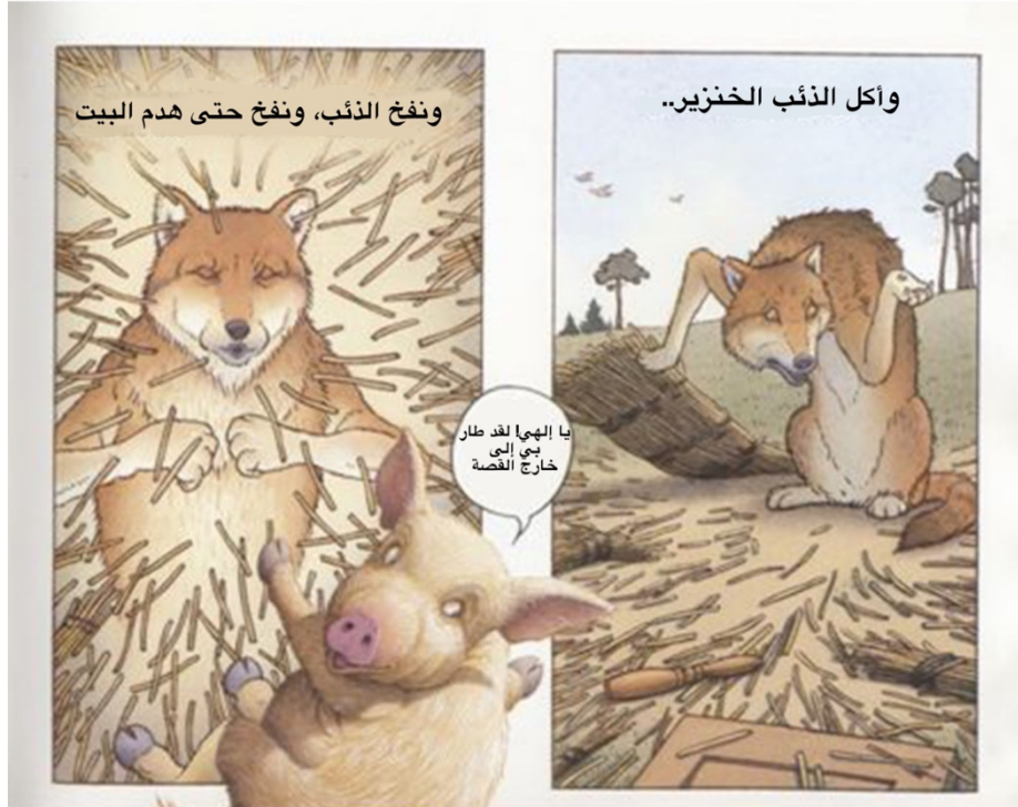
صورة ١. يأكل الذئب الخنزير وفي الوقت نفسه يخرج الخنزير من القصة

وفي كتاب ديفيد وايزنر The Three Pigs المصوّر، يمكن توضيح فكرة النص بصفتها نموذجًا بالصورة التالية (الشكل 1).