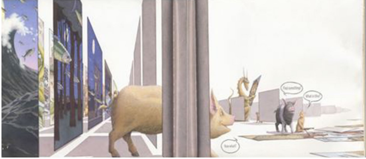
صورة ٢. تتصفح الخنازير القصص التي تمثل تاريخ الفلسفة

تشير الصور في هذا الكتاب المصوّر إلى أناشيد الحضانة المشهورة، على سبيل المثال (قفزت البقرة فوق القمر) وشخصيات قصصية مثل (الفرسان والتنانين) مشيرة إلى أدب الأطفال. بالطبع فإن هذا دائماً ما يكون اختياراً مبنياً على معايير لا واعية، سواء كانت المعايير ظاهرة أو باطنة. فأى اختيار لما يعد "محمورياً"، أو يمثل تاريخ مجال محدد، فهو محل جدل. بشكل مشابه فإن مجازي التناظري المرئي بمساعدة كتاب وايزنر المصوّر، يقوم بتوضيح كيف أن اختيار لييمان للفلاسفة والأفكار الفلسفية عبر تاريخ الفلسفة الهائل يعد مثيراً للجدل، وإن لم يكن اختياره بالضرورة اعتباطياً.